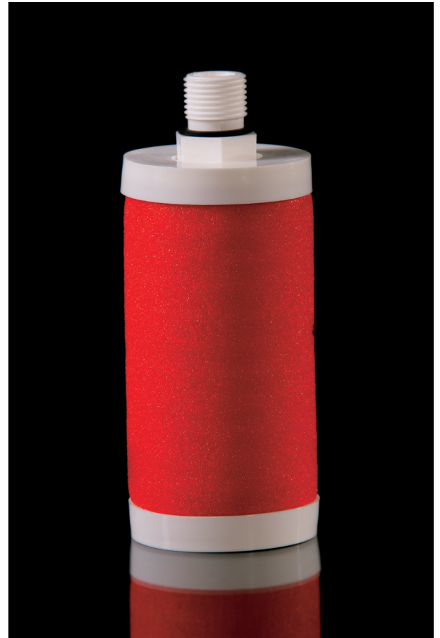
Примечание: TETPOR является зарегистрированной торговой маркой компании Parker domnick hunter